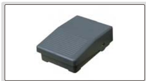
无线脚踏开关 (选配)